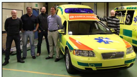
Arbetsgruppen "Nya Fordon"

Förutom de nyinvesterade fordonen (21 stycken) köps 35 stycken ambulanser in från Kamber och 20 stycken från Falck Ambulans. Totalt krävs 44 ambulanser i drift för Sirius ambulansverksamhet i Skåne. Övriga fordon blir reserver och en viss del av inköpta begagnade fordon kommer att avvecklas från verksamheten under första kvartalet 2010.