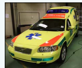
En av Sirius nya Volvoambulanser, V 70 Nilsson

Förutom de nyinvesterade fordonen (21 stycken) köps 35 stycken ambulanser in från Kamber och 20 stycken från Falck Ambulans. Totalt krävs 44 ambulanser i drift för Sirius ambulansverksamhet i Skåne. Övriga fordon blir reserver och en viss del av inköpta begagnade fordon kommer att avvecklas från verksamheten under första kvartalet 2010.