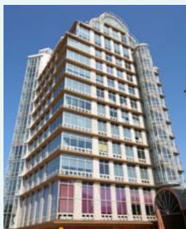
Sirius finns nu även på plats i Malmö.